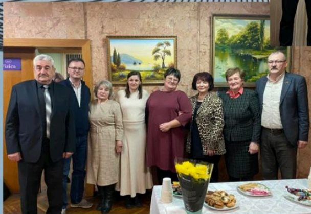
Echipa de moderatori ai claselor a XII-a